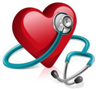
Cabinet médical Dr Sferrazza, Schrayen et Caglar