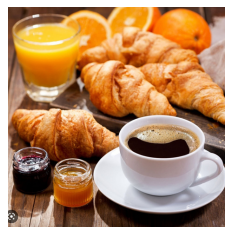
Au p'ti magasin Grand' route 76 à Flémalle